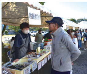
福祉施設による特産品販売