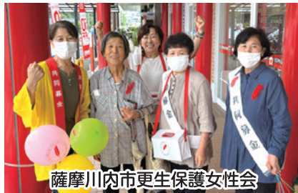
薩摩川内市更生保護女性会