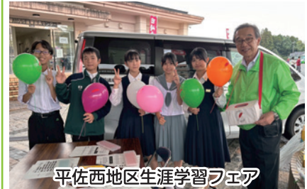
平佐西地区生涯学習フェア