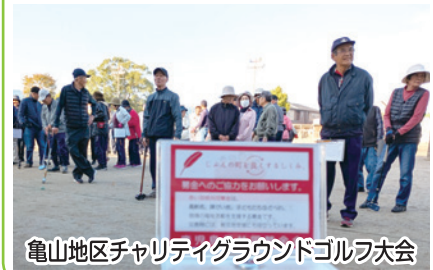
亀山地区チャリティグラウンドゴルフ大会