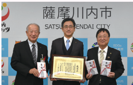
歳末たすけあい募金 共同募金 京セラ福祉基金