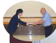
◀修了証授与の様子

権利擁護センターでは毎年、市民後見人養成講座を実施しており、今年度は16名の修了生が誕生しました。受講生の皆さまは基礎編、実践編の計25日間(68時間)にわたる座学と、高齢・知的・精神障害者分野の現場体験(各1日の合計3日間)に取り組みました。成年後見制度や福祉支援に関する見聞をより一層深めた修了生の皆さまが、市民後見人としてだけでなく地域共生社会を支える担い手として、さまざまな分野で活躍することを期待しています。