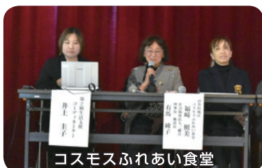
コスモスふれあい食堂

「まずはやってみよう!」から始まった食堂。1日Summer食堂や朝食型地域食堂を開催する等、様々な形で地域とつながる食堂を目指します。