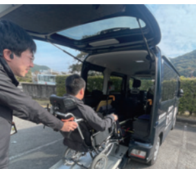
福祉タクシー試乗体験会