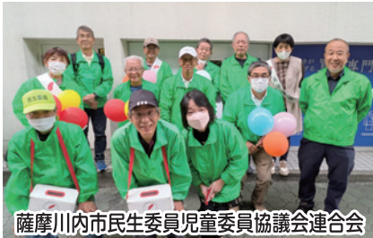
薩摩川内市民生委員児童委員協議会連合会