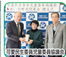
可愛民生委員児童委員協議会

社会福祉協議会では助成金を、ふれあい・いきいきサロン事業、子ども食堂（コミュニティ食堂）応援事業、自治会への助成事業である、安心・安全福祉のまちづくり支援事業など「じぶんの町を良くするしくみ」として15事業に活用しています。