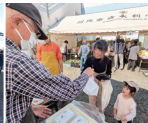
おやじごはん料理教室