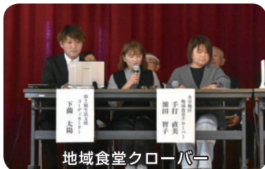
地域食堂クローバー