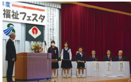
ふれあいボランティア50ポイント達成 小さな親切実行章の伝達