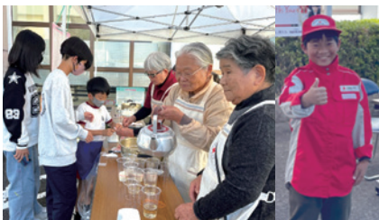
日赤炊き出し・試着ブース