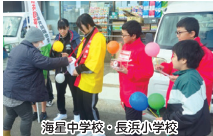
海星中学校・長浜小学校