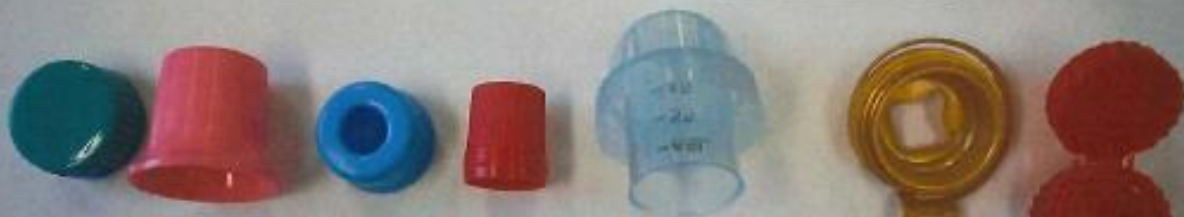
ハイター・ガスボンベ・洗剤などの生活用品のキャップ