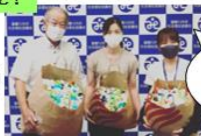
陽成地区コミュニティ協議会