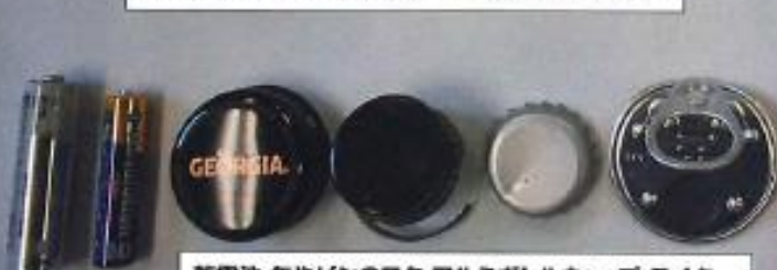
乾電池・缶やビンのフタ・アルミボトルキャップ・ライター