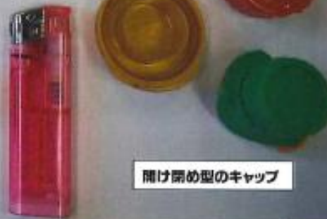
開け閉め型のキャップ