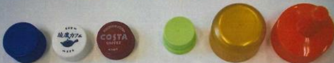
通常より大きいキャップ 直径約 3.8 から 4 cm