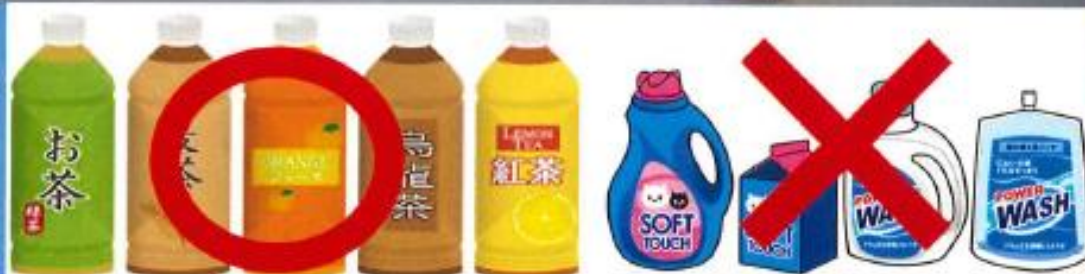
ペットボトルのキャップのみ