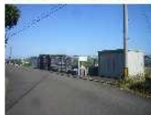
リサイクルステーション付近