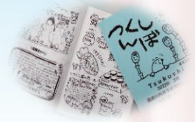
文集編集と「つくしんぼ」