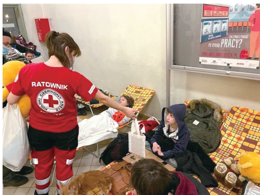
子どもにプレゼントを渡すボランティア