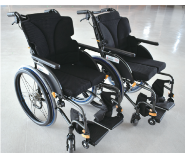
京セラ60周年記念プレミアムギフト事業