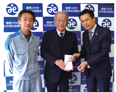
九州電力株式会社 川内原子力発電所