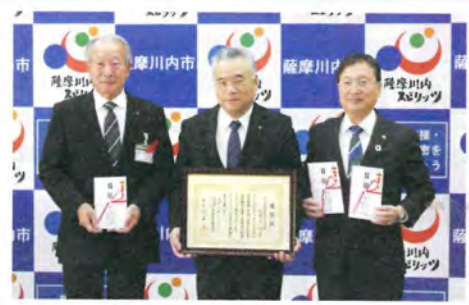
歳末たすけあい募金 共同募金 京セラ福祉基金