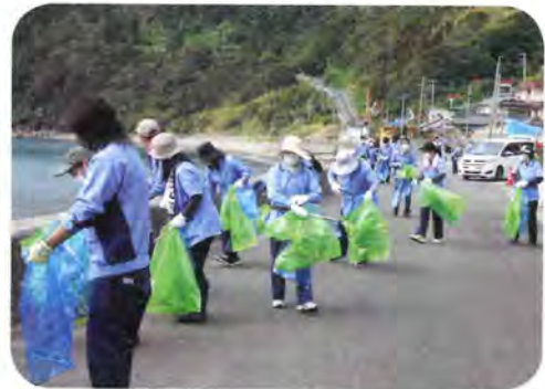
▼(株)岡野エレクトロニクスの皆さんによる 芦浜地区での活動の様子

去る10月18日、樋脇町の(株)岡野エレクトロニクスの皆さんによるボランティア活動が行われました。当日は薩摩川内市役所職員の状況説明を受けてから、海岸等に打ち上げられたゴミを収集する活動を熱心に行われていました。同社は台風10号の被害状況を聞き下甌地域でのボランティア活動を決められたとのことで、島外からのボランティア活動は珍しく地域住民の方々から多くの感謝の言葉が寄せられています。