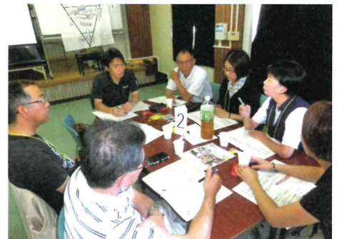
第2層協議体 (川内北中学校区)