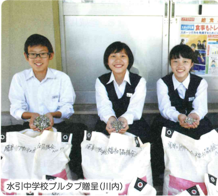
水引中学校プルタブ贈呈(川内)