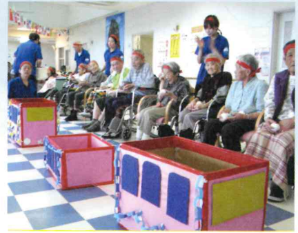
特養甑島敬老園運動会