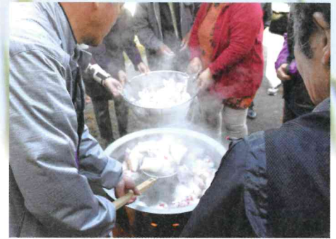
炊き出し訓練 (草道上サロン)