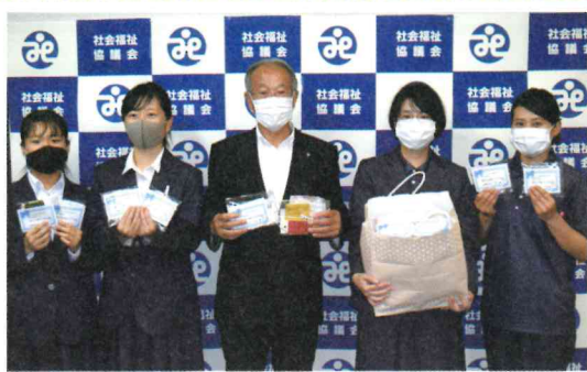
川内市医師会立川内看護専門学校から 手作りマスクの寄贈