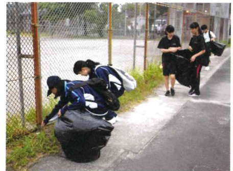
川内川花火大会清掃ボランティア