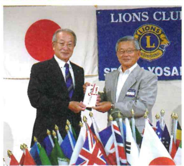
さつま川内未来ライオンズクラブ (旧 川内よさこいライオンズクラブ)