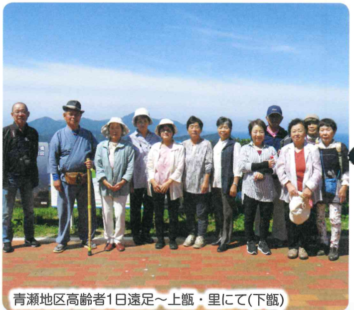
青瀬地区高齢者1日遠足～上甑・里にて(下甑)