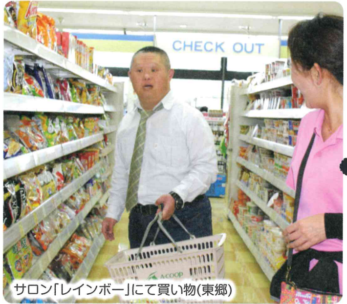
サロン「レインボー」にて買い物(東郷)