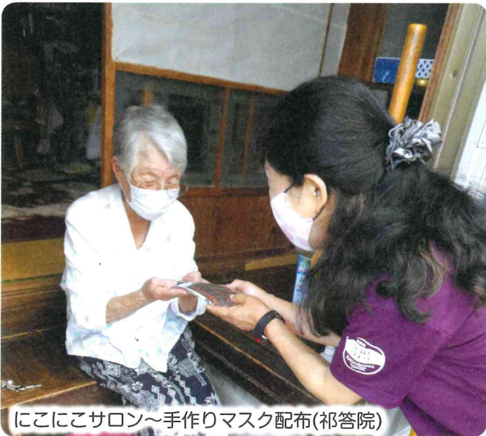
にこにこサロン～手作りマスク配布(祁答院)