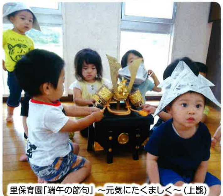
里保育園「端午の節句」～元気にたくましく～(上甕)