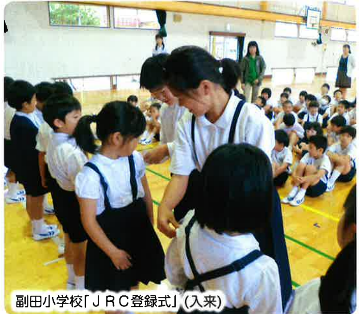
副田小学校「JRC登録式」(入来)