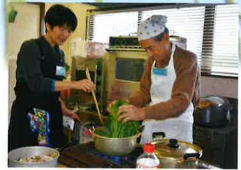
シニア男性料理講座