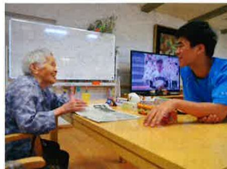
サマーボランティア