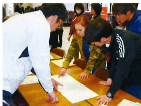
災害時相互協力研修会