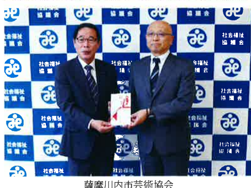
薩摩川内市芸術協会