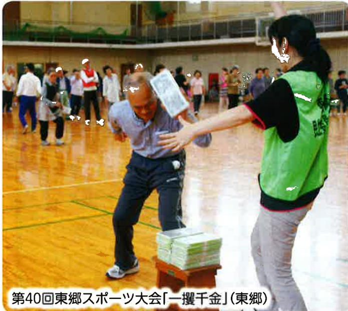
第40回東郷スポーツ大会「一攫千金」(東郷)