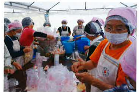
非常炊き出し訓練（川内川水防演習）