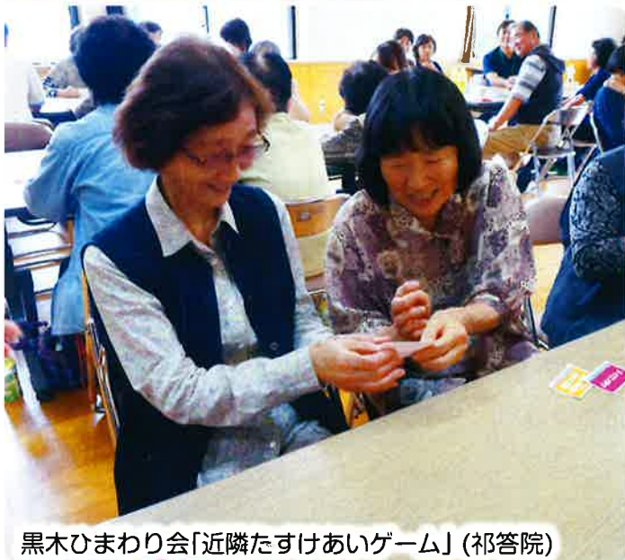
黒木ひまわり会「近隣たすけあいゲーム」(祁答院)