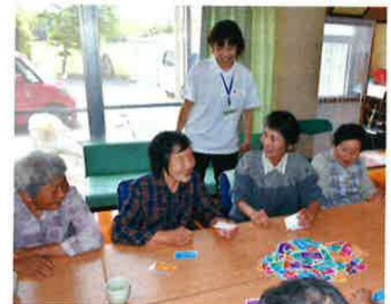
ふれあい・いきいきサロン

相談件数193件／就活セミナー 計8回 延べ47名／冬休み宿題塾の開催 無料職業紹介所の求人登録件数9件／支援調整会議の実施