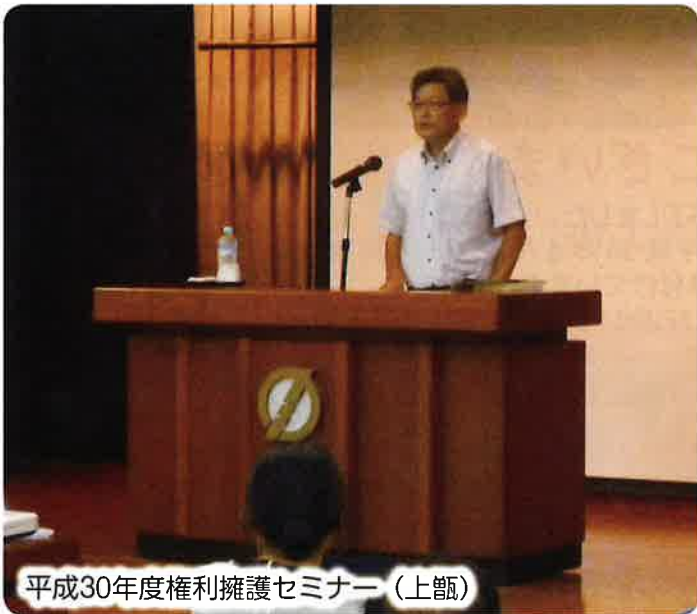
平成30年度権利擁護セミナー(上甑)