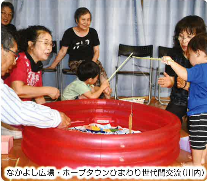
なかよし広場・ホープタウンひまわり世代間交流(川内)