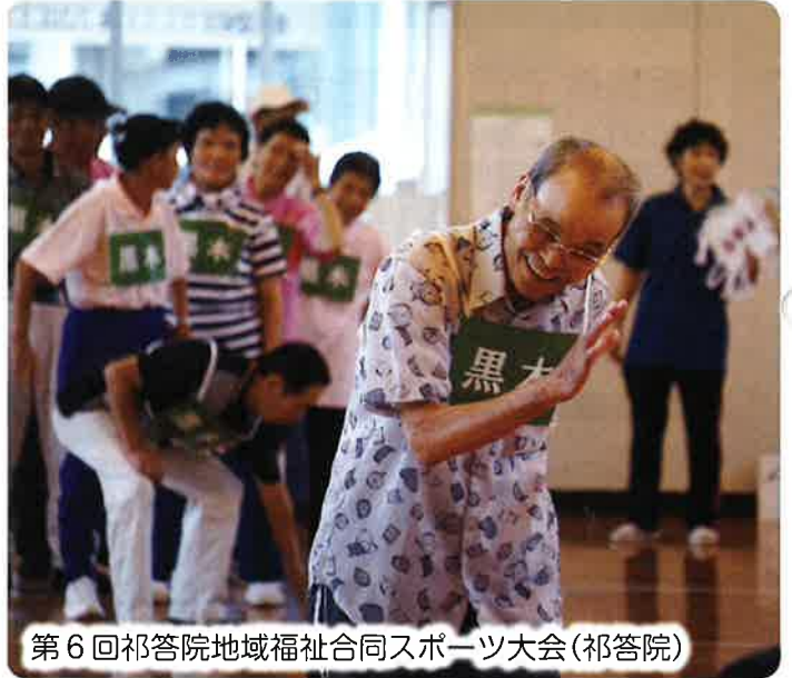
第6回 祁答院地域福祉合同スポーツ大会(祁答院)