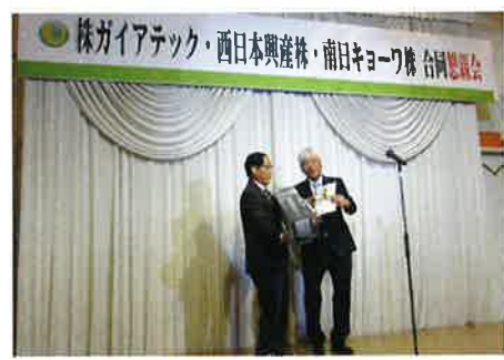
寄贈 車イス12台ほか 協賛 ガイアテック・西日本興産(株)・南日キョーワ(株) 台ほか 3社合同観望ゴルフコンペ

寄附金控除についてのご案内 当社会福祉協議会への寄附は所得税の寄附金控除、法人税の損金算入の対象となります。また鹿兒島県にお住まいの方は、申告により一定の額が個人県民税の税額から控除されます。確定申告または住民税の申告に際して、当会発行の領収書を添付してください。詳しくは最寄りの税務署、お住まいの市町村の住民税担当窓口にお尋ね下さい。 皆様の善意に感謝し地域福祉推進のために役立たせていただきます。