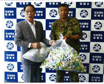
陸上自衛隊川内駐屯地 曹友会様より ペットボトルのキャップ・プルタブの寄贈