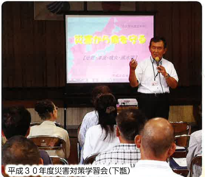
平成30年度災害対策学習会(下甑)