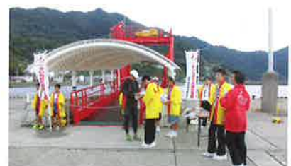
鹿島スポーツ少年団、海星中、海陽中の生徒による街頭募金