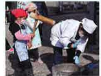
ふれあい餅つき大会 (手打地区)