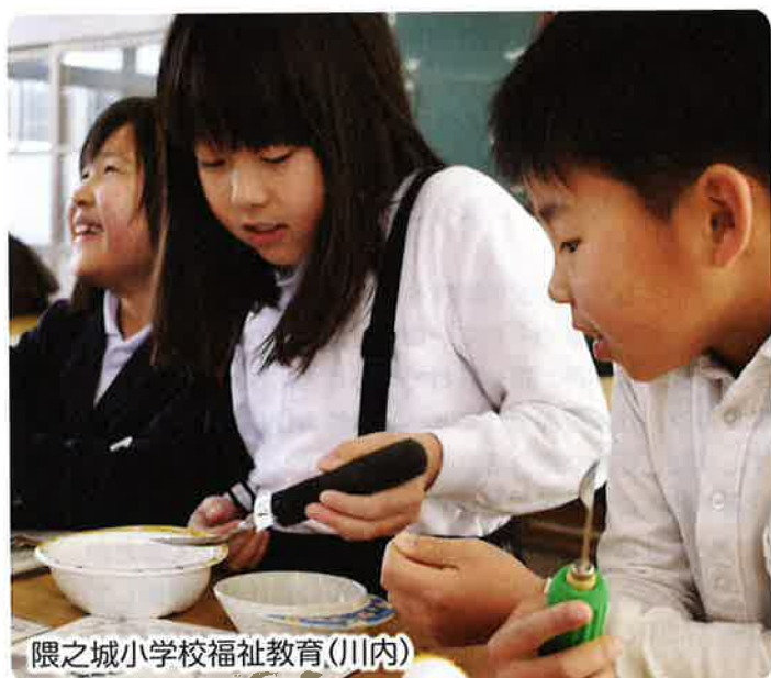
隈之城小学校福祉教育(川内)