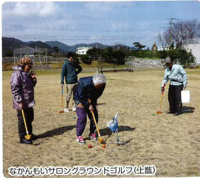
なかんもいサロングラウンドゴルフ(上甕)