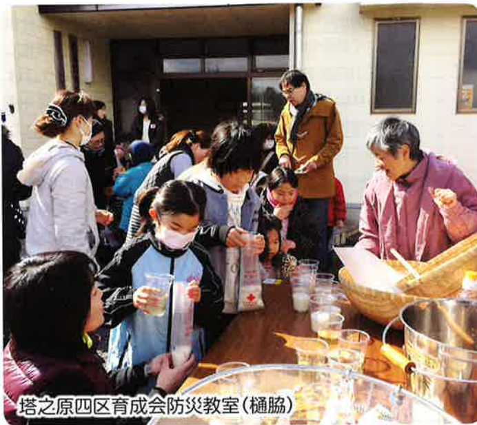
塔之原四区育成会防災教室(樋脇)