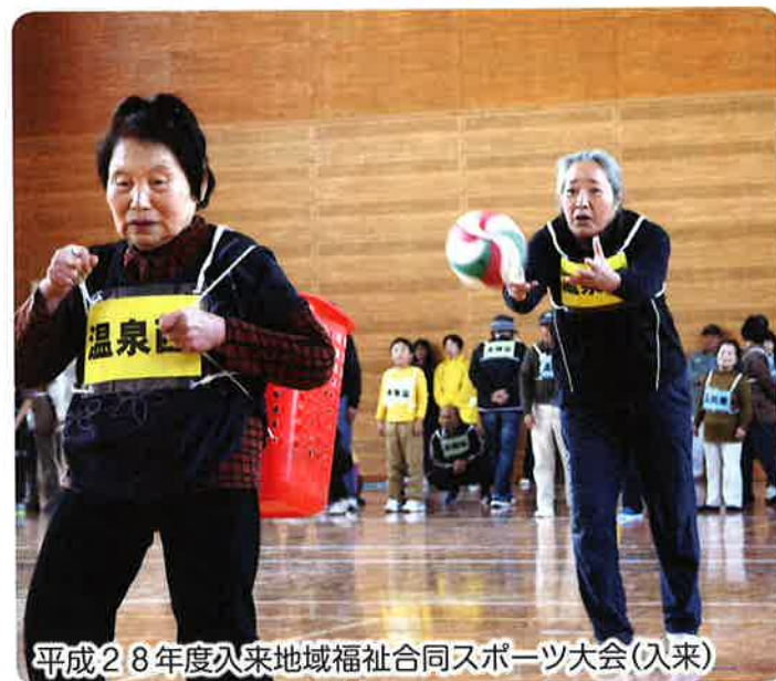
平成28年度入来地域福祉合同スポーツ大会(入来)