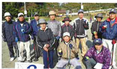
イベント募金 東郷地域チャリティグラウンドゴルフ大会