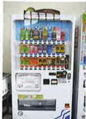
募金機能付自販機

皆さまから頂きました募金は、歳末たすけあいの事業や県内の福祉団体・福祉施設助成事業、また、市町村の地域福祉活動に充てられます。厚くお礼申し上げます。